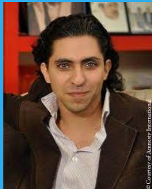
Raif Badawi – 2015, Σαουδική Αραβία