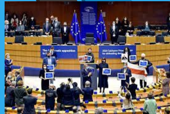
Η δημοκρατική αντιπολίτευση στη Λευκορωσία - 2020 Λευκορωσία