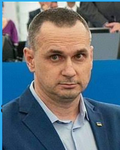
Oleg Sentsov – 2018, Ουκρανία