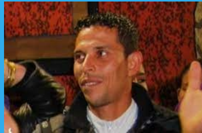
Mohamed Bouazizi – 2011, «Αραβική Άνοιξη», Τυνησία