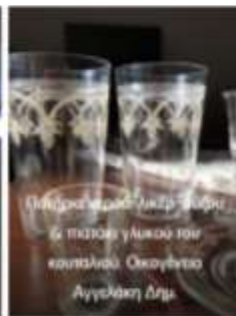
Παλιό κρυστάλλινο φλιτζάνι και ποτήρι γλυκού του κουτιλιού. Οκαγένας Αγγελάκη Δημ.