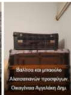
Βαλίτσα και μπουκιέ Αλασατανών προσφύγων. Οκαγένας Αγγελάκη Δημ.