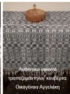
Λαθινικά σφαιρικά τραπέζιμάνηλα/ κουβέρτα. Οκαγένας Αγγελάκη