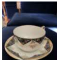
Φλιτζάνι από φέλιτσιο και σαμάκι. Οκαγένας Αγγελάκη